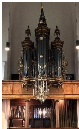
Namens het CvK Ab Lokerse

Begin dit jaar heeft het CvK de knoop doorgehakt om het orgel volledig te gaan restaureren. Hiervoor is door Aart Bergwerff orgeladviseur een inspectie en restauratie rapport gemaakt waar de basis vormde voor een subsidie aanvraag bij de Provincie Zeeland, in het kader van de restauratie rijksmonumenten. Maandag 26 augustus ontvingen wij het bericht dat een bedrag van € 243.322,- is toegekend. De totale restauratie kosten bedragen echter € 434.303,- er blijft dus nog een groot bedrag te overbruggen. Hiervoor zullen de komende tijd diverse fondsen worden aangeschreven acties voorbereid en ons orgelfonds zal worden aangesproken. Heeft u een leuk idee om de nodige euro's in te zamelen dan houden wij ons aanbevolen | De restauratie staat gepland voor 2026.